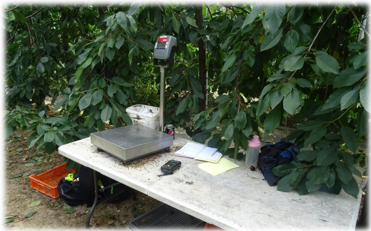
Figura 10 - Bancada de trabalho posicionada na entrelinha

A bancada de trabalho usada para fazer a seleção de frutos deve ser limpa e desinfetada pelo menos uma vez por dia antes do início da triagem. Esta operação deve ser repetida sempre que se julgue necessário.