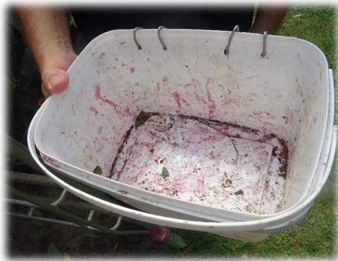
Figura 9 - Balde de colheita

Como as árvores têm uma altura máxima de 2,50m não será necessário usar escadotes bastando o uso de ganchas para puxar os ramos facilitando-se, assim, a colheita. Os trabalhadores também podem transportar baldes de colheita presos à cintura (com capacidade de 4kg) nos quais vão colocando as cerejas. As cerejas são, de seguida, despejadas em caixas de colheita. Cada trabalhador deve possuir um carrinho de colheita onde pode colocar caixas de colheita cheias e vazias. Este método torna o processo de colheita mais rápido e eficaz. Deve-se fazer 2 a 3 passagens por árvore. Uma passagem é feita nos topos das árvores e na base são feitas uma ou duas passagens. Em média, um trabalhador consegue colher cerca de 18 kg/h.