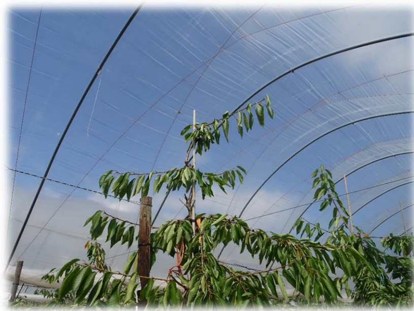
Figura 5 - Disposição dos ramos ao longo do eixo vertical

O sistema de condução recomendado é o de eixo central revestido. A poda de formação deve ser realizada nos primeiros dois anos para estruturar a árvore. Deve manter-se a continuidade do ramo principal. Os ramos laterais devem ser finos, estar cerca de 20cm afastados uns dos outros e, tanto quanto possível, dispostos horizontalmente. É recomendado que os ramos basais fiquem inseridos a pelo menos 40cm do solo para facilitar a aplicação de herbicidas junto à linha. As intervenções de poda devem ser realizadas o mais cedo possível, efetuando-se uma poda reduzida. As árvores não devem ultrapassar 2,50m de altura para que a colheita seja realizada pelo operador do solo sem recurso a equipamentos. É importante que a poda seja realizada em verde pois, deste modo, garante-se uma melhor cicatrização dos tecidos comparativamente com a época de repouso vegetativo.