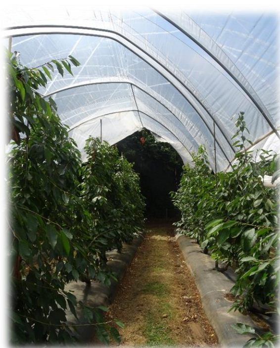
Figura 4 - Tela a cobrir os camalhões

É importante adquirir plantas provenientes de viveiristas licenciados, com bom estado sanitário, bem desenvolvidas, fazendo a encomenda o mais cedo possível pois durante a campanha de plantação existe