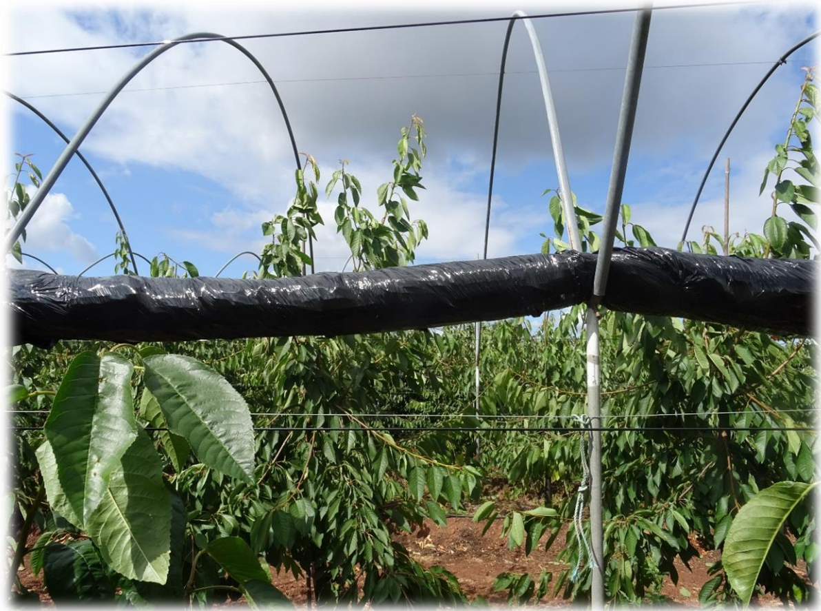
Figura 3 - Plástico preto a envolver a cobertura do túnel

Os túneis devem voltar a ser cobertos aquando do início do abrolhamento. A abertura e fecho dos túneis é feita com forquilhas e cordas, prevendo-se que se necessite de 72 horas de mão-de-obra para fechar a cobertura (são necessários 9 trabalhadores para cobrir 1 hectare num dia) e 24 horas para a abrir (3 trabalhadores conseguem concluir 1 hectare num dia).