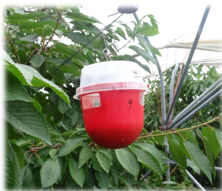
Figura 6 - Armadilha anti-drosófila

No combate à drosófila-de-asa-manchada, recomenda-se o uso de armadilhas Droso-Trap ou Biobest (armadilhas de cor vermelha com um atrativo específico) – figura 6.