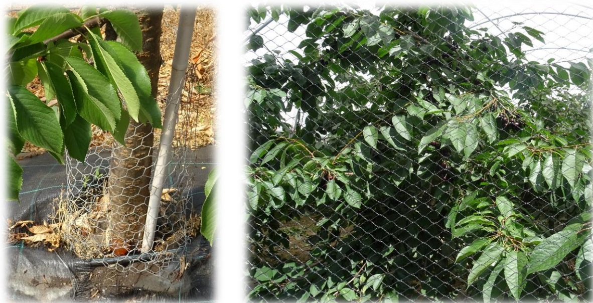
Figura 7 - Rede de arame a proteger o tronco (esquerda); rede anti-pássaro no topo do túnel (direita)